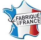
Caisse emboutie avec marquage "Made in France"